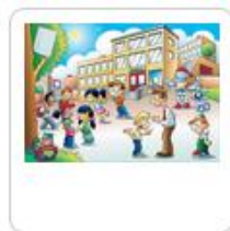
Cahier de vie de L... Enseignant B

6- Une fois le cahier dupliqué, il retrouve le cahier qu'on lui a partagé et un cahier en tout point similaire, nommé « [INTITULE DU CAHIER] – Copie », dont il est cette fois-ci le propriétaire