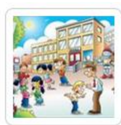
Cahier de vie de Loïc